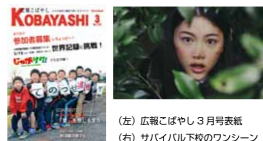
(左) 広報こぼやし3月号表紙 (右) サバイバル下校のワンシーン

県内市町村の優れた広報作品を表彰する平成28年(53回)宮崎県広報コンクールで、市は広報紙(市)の部で広報こぼやし3月号、映像の部で小林秀峰高校と協働で制作した「小林市PRムービー「サバイバル下校」」が最優秀賞にあたる特選を受賞しました。特選を受賞した2作品は、全国広報コンクールに出品されます。