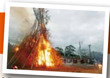
1月8日には「どんど焼き」を行いました

イスブックのページも開設。SNSなどを活用して、地域の交流人口増加のために情報発信をしています。昨年11月に霧島岑神社で開催した古事記神話イベント「古の誘い」や今年1月8日に開催した「細野どんど焼き」でも市内外から多くの方が細野地区を訪れてくれました。これからも地域の情報をいち早くお届けしていきます。