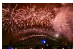
①日本の大晦日②オーストラリアの大晦日