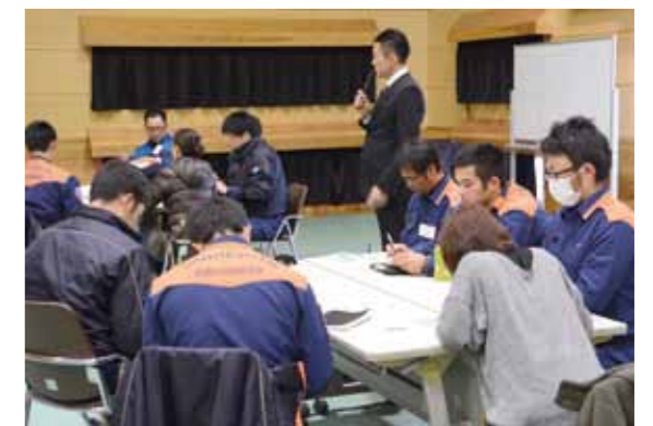
参加者は、多数傷病者が出たときに、患者の緊急度などによって治療や搬送の優先順位を決める「トリアージ」などを学びました