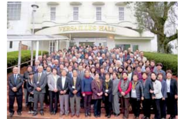
民生委員・児童委員の皆さん。これから3年間、住民の相談相手、行政とのパイプ役などとして地域福祉のために尽力いただきます