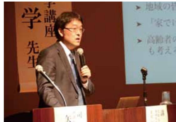
研修会には、医療関係者や一般市民の209人が参加。ユーモアを交え、西諸地域の在宅医療の実情などを訴えていました