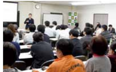
コンテスト開催に伴い、説明会も実施