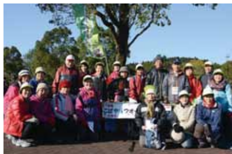
こばやしウォーキングクラブの皆さん

中皮腫や肺がんなどを発症し、それが労働者として石綿ばく露作業に従事していたことが原因であると認められた場合には、労災保険法に基づく各種の労災保険給付や石綿救済法に基づく特別遺族給付金が支給されます。 石綿による疾病は、石綿を吸ってから非常に長い年月を経て発症することが大きな特徴です。中皮腫などで亡くなった人が過去に石綿業務に従事されていた場合には、労災保険給付などの支給対象となる可能性がありますので、まずは気軽に宮崎労働局または宮崎労働基準監督署に相談ください。 制度のご案内は厚生労働省ホームページでも確認できます。