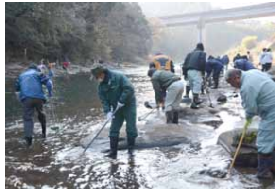
ほうきやブラシを使って、オオヨドカワゴロモの表面をこする参加者。滑りやすい足場に気を付けながら清掃を行いました

1月21日、平成28年3月に国指定天然記念物に指定された「オオヨドカワゴロモ」の自生地である岩瀬川の清掃活動を行いました。この活動は、22年前から取り組んでおり、今年は土木関係者や市民ら62人が参加。参加者は、オオヨドカワゴロモの生態や表面のゴミのとり方を学びながら清掃しました。