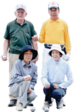
小林市ペタンク協会の皆さん