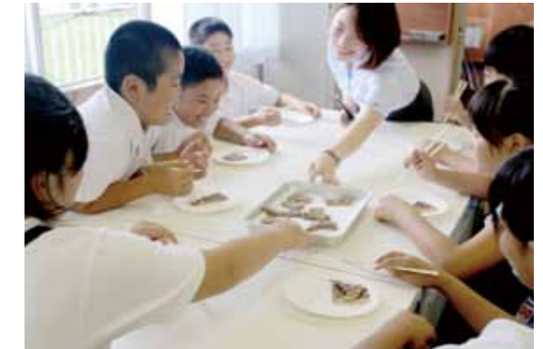
宮崎牛と外国産の牛肉を食べ比べる児童ら。この教室は、より良い宮崎牛づくり対策協議会が県内小学校で開いている授業の一環です