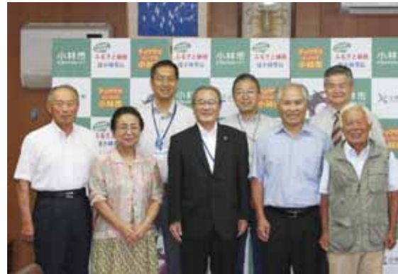
今回、委嘱された審議員の皆さん。任期は平成30年6月までの2年間で、随時審議を行っていきます

7月5日、景観審議会委員の委嘱状交付が行われました。今回、市の景観に対する意見をいただくため9人に委嘱。今後、市の自然景観、農村集落などの生業景観、歴史的まちなみ景観、まちなか景観、水辺景観などの守るべき景観、つくる景観、そだてる景観について審議していきます。