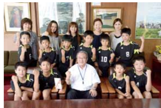
優勝を誓いガッツポーズをする同団選手の皆さん。九州大会は、8月20日から21日にかけて福岡県で開催されます

7月1日から3日にかけて、国体九州ブロック大会を前にボート競技県選抜チームの強化合宿が須木地区の小野湖で行われました。水面が穏やかで流木も少なく、直線距離1キロを取れることなどから小野湖が合宿地に決定。県内の高校生や大学生など30人が参加し、技術を磨きました。