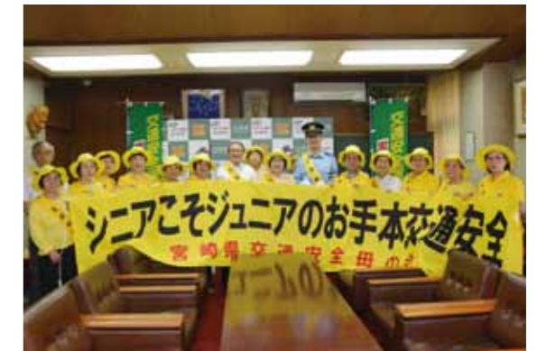
伝達式に出席した市長、警察署長、県交通安全母の会、市地域婦人連絡協議会の会員ら。