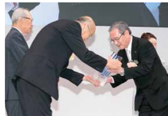
トロフィーを受け取る肥後市長。広告電通賞は、優れた広告企画や広告表現技術を示した広告主を表彰する歴史ある広告賞です

市が制作した「小林市移住促進PRムービー」ンダモシタン小林」が第69回広告電通賞のデジタル・メディア部門で最優秀賞、テレビCM部門で優秀賞を受賞しました。7月1日、贈賞式が東京で開催され2000人が出席する中、賞状とトロフィーを受け取りました。