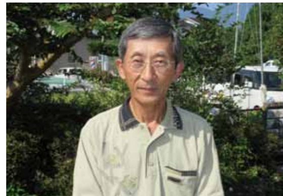
人権・なやみごと相談は月に5回行っています。相談は無料で秘密厳守になっておりますので、お気軽におこください