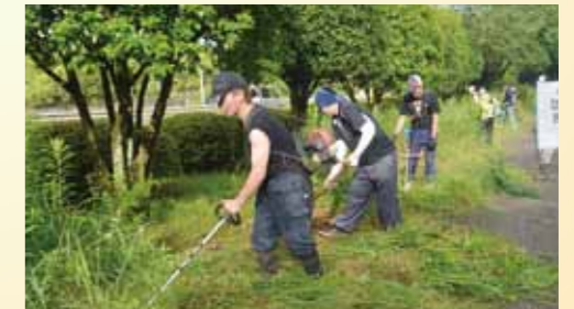
祭り会場であるのじりこびあで草刈りを行う実行委員。会場の設営やイベントの企画をすべて自分たちで行います。