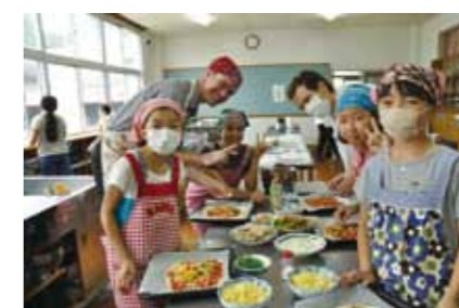
クッキング! (ピザ作り)