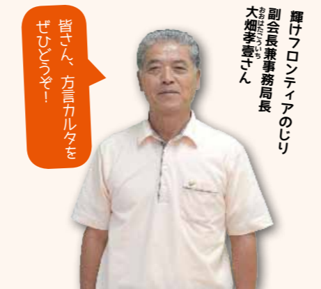
皆さん、方言カルタをぜひご利用ください！