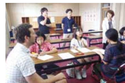
ゲームで楽しく学びます♪

この事業を通して、子どもたちが外国の人と触れ合いの中で、外国の言葉や文化に興味を持ち、将来、世界で活躍するような小林人に育ってもらうことが目的です。