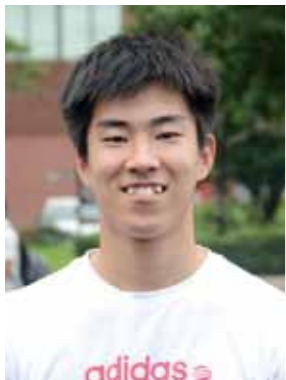
宮崎大学工学部1年 (平成28年3月卒)