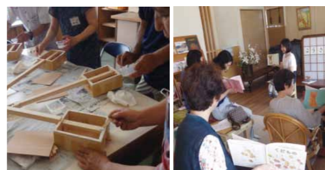
左) ごったん講座の様子 右) 絵本の読み聞かせ講座の様子