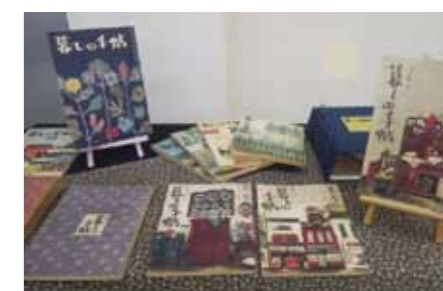
展示期間終了後は、特別貸出を行います

テレビで放映中の「とと姉ちゃん」で話題の雑誌「暮らしの手帖」創刊号から現在に至るまでほとんどの号を