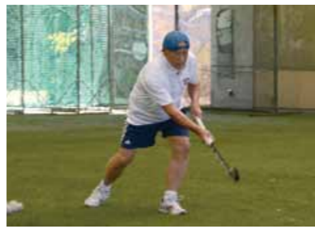
一人黙々と練習に励む。半面反ったスティックで、ボールを力強くゴールに打ち込む