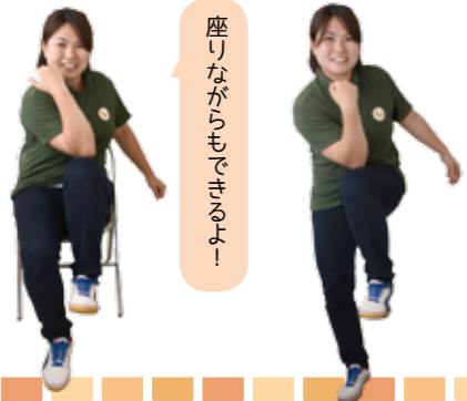
座りながらできるよー！