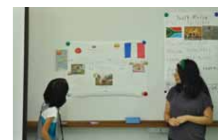
フランスについて発表