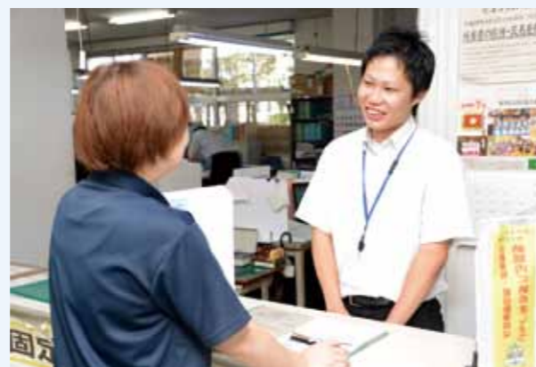
接遇向上委員会を設置し、さらなる市民サービスの向上を目指しています。

その中で、市民の意見をこの改革に反映するために市民ら15人で構成される「小林市行政改革市民会議（以下、市民会議）」を設置しています。7月19日に、今年度第1回目となる市民会議を開催しました。今回の会議では、「職員の接遇向上」、「人材育成」、「市民と職員の情報共有の推進」、「情報発信の強