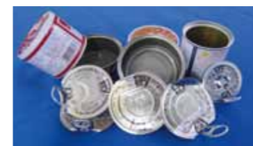
「缶詰のふた」 答えは左のページ。