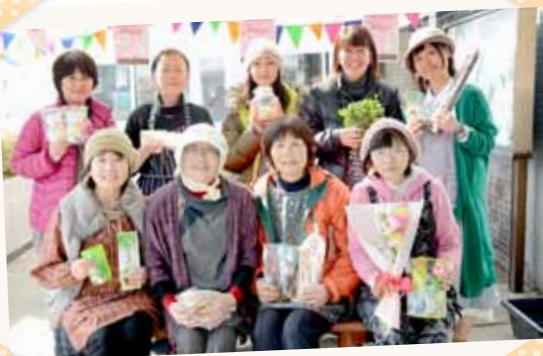
こばやしマンの皆さん