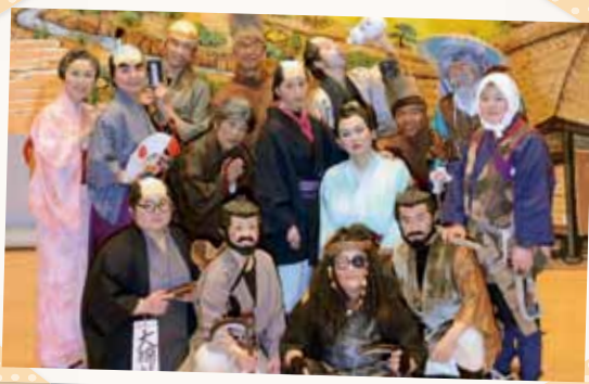
すき歌劇団コスモス組の皆さん