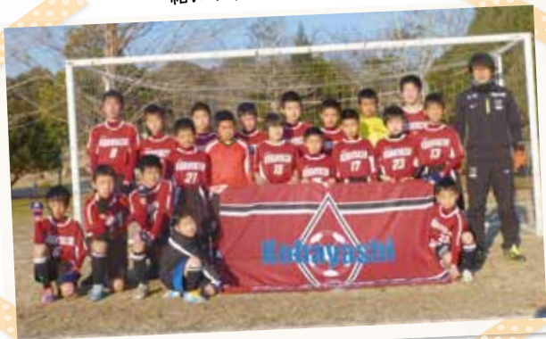
小林サッカースポーツ少年団の皆さん