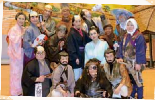
すき歌劇団コスモス組の皆さん