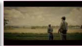
(左) 広報こばやし11月号表紙 (右) ンダモシタン小林のワンシーン