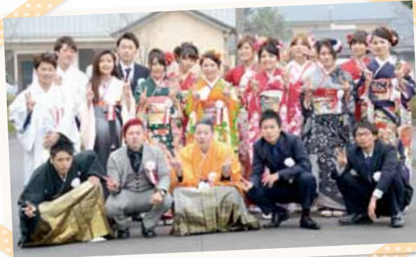
成人式実行委員会の皆さん