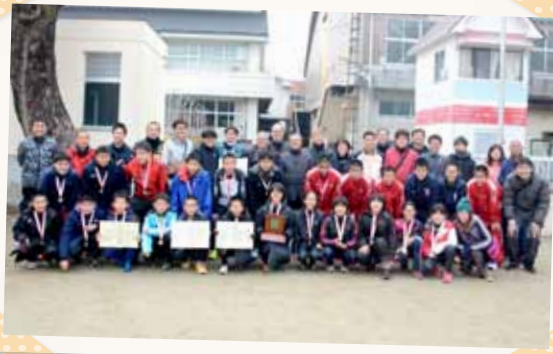
宮崎県市町村対抗駅伝競走大会の選手、スタッフの皆さん