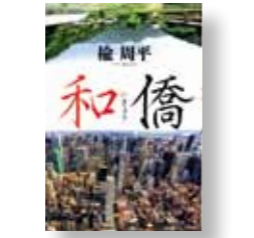
【和】 著者：榎 周平 発行：祥伝社