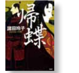
【帰蝶】 著者：諸田 玲子 発行：PHP 研究所