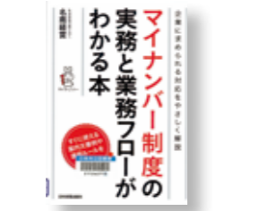
【マイナンパー制度の実務と業務フローがわかる本】 著者：名南 経堂 発行：日本実業出版社