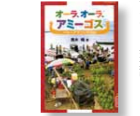
【オーラ、オーラ、アミーゴス～ペルー・アマゾン交流記～】 著者：黒木 暢 発行：勉誠社