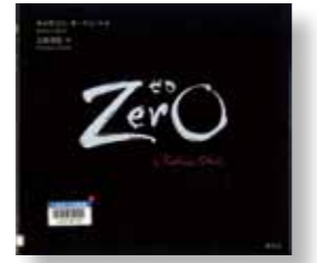
【Zero ゼロ】 作・絵：キャサリン・オートシ 訳：乙武 洋匡 発行：講談社