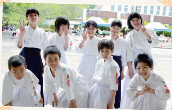
鳥田町剣道スポーツ少年団の皆さん