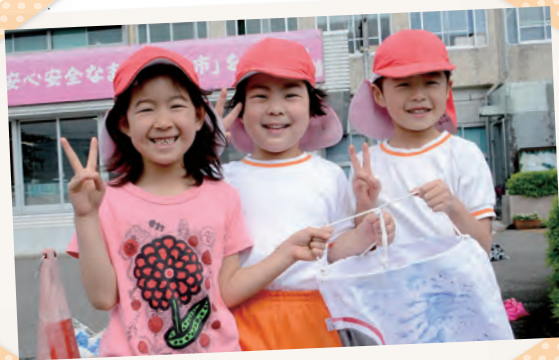
中央保育所の園児の皆さん