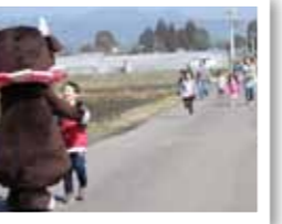
最近ではツアーの企画をしてました。東日本大震災を受けて宮崎県(主に宮崎市内)に避難をされた方々を対象にした復興を願う県の事業です。(寒い方)は知らない人ばかり。少しでも楽しんでもらい、また遊びに来ようと思ってもらえるよう作戦を練りました。いちこの丘さんでイチゴ狩り、ダイワファームさんでチーズを乗せたピザを味わい、とどめは摘み立てのイチゴを混ぜたヨーグルトのデザート!期待以上のおもてなし頂き、恐縮、そして本当に感謝です。やっぱ小林、素晴らしいなあ。