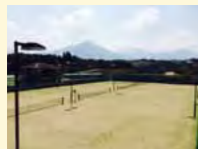
総合運動公園内のテニスコート4面を改修し、新しくなりました。

昨年も市では、30年後を見据えた持続可能なまちづくりを推進し、さまざまな事業を展開してきました。ここでは、その中から4つの事業を紹介します。