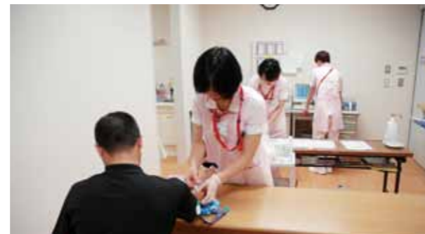
各種健診で、病気の早期発見、治療につなげます