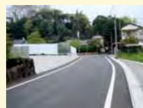
細野の堀之内1号線が新しくなり、広くなりました。