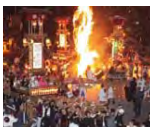
能登町の「あばれ祭」。今年は、7月3～4日に開催予定。

◆対象経費 ・交通費 ・姉妹都市での宿泊料 など ◆補助額 1人あたり上限3万円 ◆募集期間 随時 ※予算がなくなり次第終了