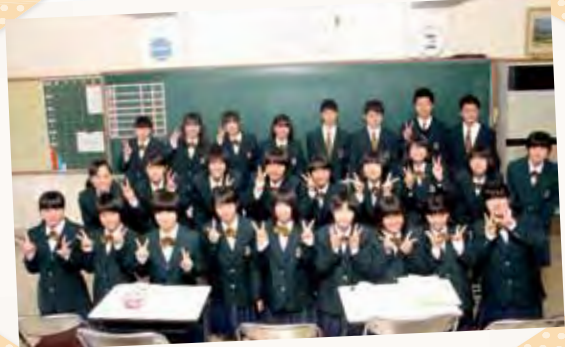
小林看護学校の新生