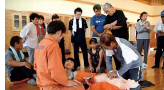
災害発生時、地域で助け合える体制をつくるため、自主防災組織の活動を支援します