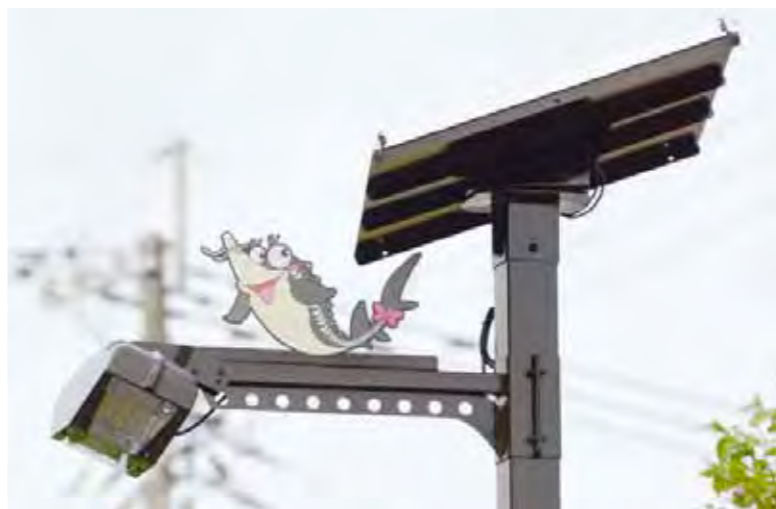
中心市街地に設置された多機能次世代ソーラーLED街路灯

小林商工会議所は、維持が難しくなっていた中心市街地の旧街路灯を撤去し、国と市の補助を受けて新しい街路灯を設置しました。多くの機能が備わった全国初のLED街路灯で、また一步「九州一安心安全なまち」に近づきました