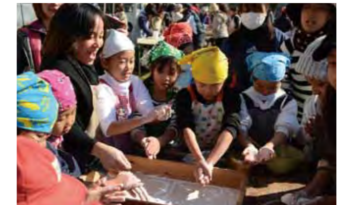
26年度で3地区となったきずな協働体。今年、野尻地区で設立される予定です