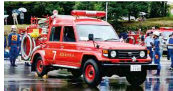
水流迫地区と東方地区の消防車を更新します