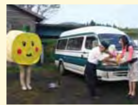
内山・野尻間に新たに福祉バスが運行を開始しました。