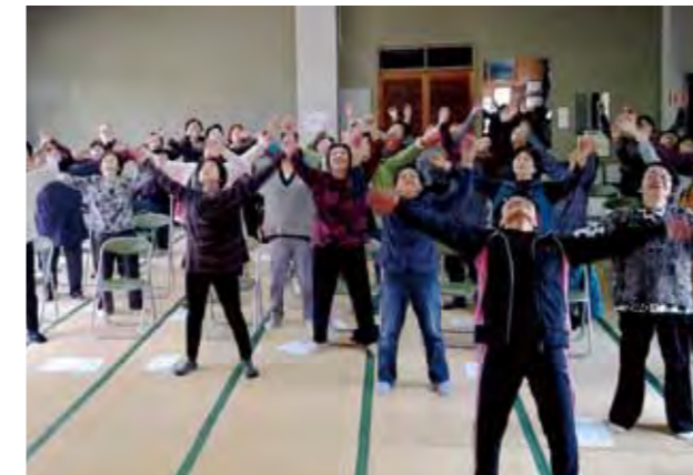
健康で長生きするための、健康づくりを行います