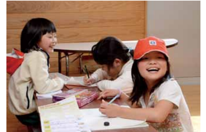
4月に栗須小に放課後児童クラブを設置しました