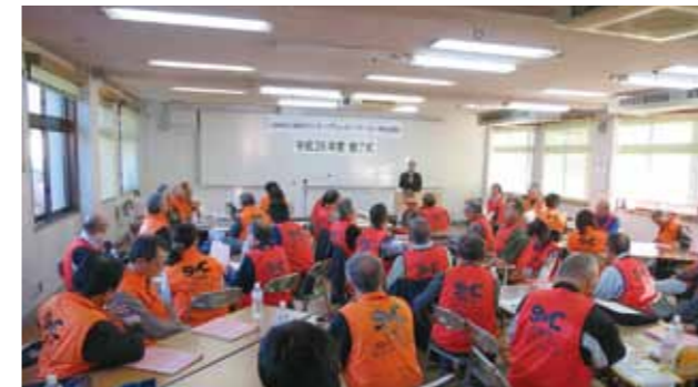
昨年、第1期の災害ボランティアコーディネーター59人が誕生しました