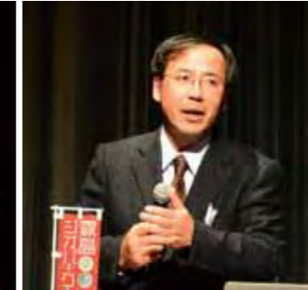
霧島山の現状を説明した東京大地震研究所の中田節也教授