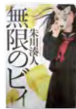
「無限のピエ」 著者：朱川 湊人 発行：徳間書店