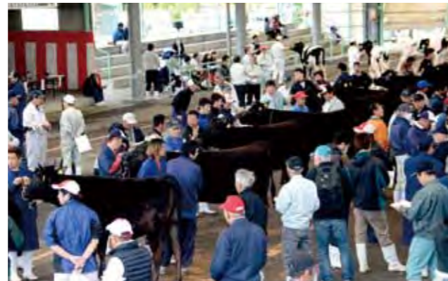
畜産のまちのさらなる振興を図ります