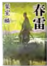
「春雷」 著者：葉室 麟 発行：祥伝社