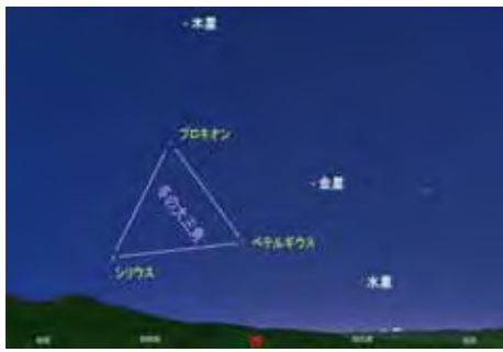
5月10日19時50分頃の西天