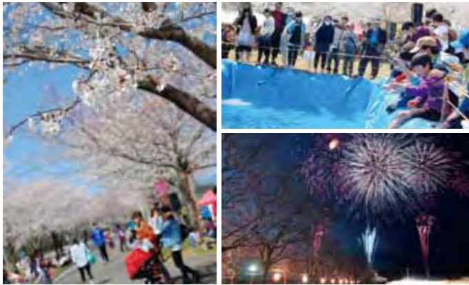
釣り堀体験なども今年初めて実施したまきばの桜まつり

まきばの桜まつりの様子は、インターネット動画でも配信中。「YouTube 小林市公式チャンネル」で検索ください。