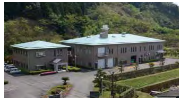
小林高原衛生事業事務組合解散後、し尿処理施設を運営