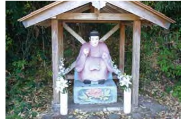
【享保5年作「新田場の田の神」(宮崎県内最古)】

田の神像は、田の神さあとも呼ばれ、皆さんにとって身近な文化財の一つだと思えます。市内には、約90体の田の神像があり、鹿児島県のほぼ全域と宮崎県では、小林・えびの・都城・三股・高原・綾・国富・高岡の地域に田の神像が見られます。なぜ、多くの田の神像が地域限定で作られたのでしょうか？