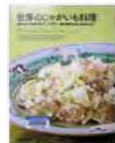
「世界のじゃがいも料理」 編者：誠文堂新光社 発行：誠文堂新光社