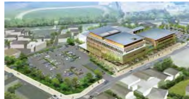
新庁舎の外観のイメージ。完成は28年度の予定