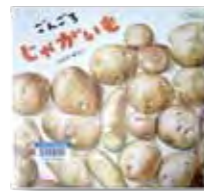
「ごんごろじゃがいも」 作：いわさ ゆうこ 発行：童心社