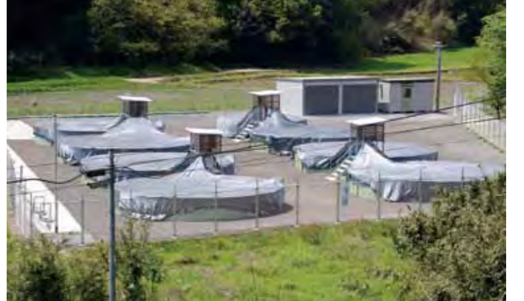
Photo 1 直径6mの水槽1基と8m水槽7基を設置し、現在、900匹を飼育。3年後には1500匹を飼育する予定。2 自動給餌機を使い、餌の管理を行います。3 水槽は、井戸からくみ上げたきれいな水で常に満たされています。