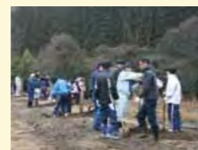
「もみじの里づくり事業」で広葉樹などを695本植樹しました。