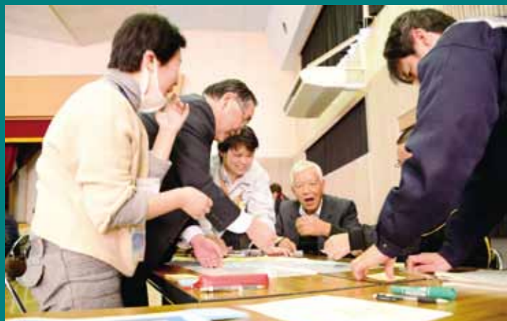
（写真）出し合った意見の分類などを行う参加者ら

故郷の良いところや悪いところを再認識する機会になり、さまざまな分野・年齢の人の意見が聞かれて勉強になりました。気軽に意見が言い合えたのもよかったです。若い人たちも、まちや未来に対する意見を出せる機会になるはず。夢を語るだけでもいいんです。ぜひ多くの人が参加して、まちの未来を語り合えればいいですね。