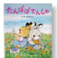
「たんぽぽでんしゃ」 作・絵：ひろかわ さえこ 発行：ひさかたチャイルド