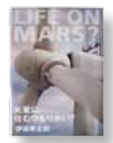
「火星に住むつもりかい?」 著者：伊坂 幸太郎 発行：光文社