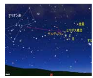
4月21日20時の西天 (図はステラナビゲータで作成)

春 の訪れを謳歌しているかのような鳥のさえずりは、心地良いものです。星が見やすい時期になつてきました。 オリオン座が西に傾く春の日暮れ時。4月21日は西の空を注目しましょう。星図の時刻、ほぼ夜の帳がおりる2時ごろが良いでしょう。まず目に飛び込んでくるのが、三日月。しばらく眺めていると光っていないはずの暗い部分が薄らと見えてきませんか。太陽の光を受けた地球は、鏡のようにその光を宇宙に反射します。特に太陽に近い方向ほど多く反射されます。新月から間もないこのころの月は、見かけ上、太陽の傍に