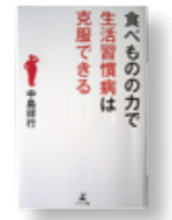
「食べものの力で生活習慣病は克服できる」 著者：中島 祥行 発行：幻冬舎