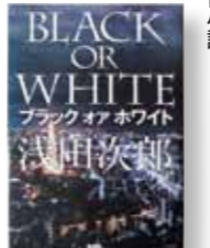
「ブラック オア ホワイト」 著者：浅田 次郎 発行：新潮社