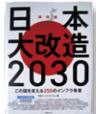
「日本大改造2030」 編者：日経コンストラクション 発行：日経BP社