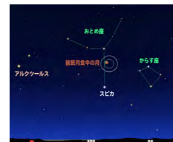
4月4日21時の東～南東の星空 (図はステラナビゲータで作成)

【本館】1日と毎週月曜 ◆開館時間 9時～19時 日曜および祝日は17時まで 【須木分館・野尻分館】 1日と毎週月曜・祝日 ◆開館時間 ・須木：9時～17時 ・野尻：10時～18時30分 ※日曜は17時まで