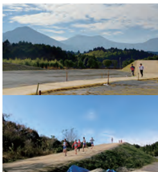
写真上) クロカンコースから見える霧島山 写真下) 昨年12月に開催された小中学生のリレー大会の様子