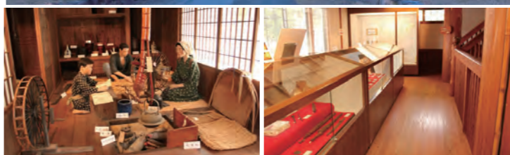
写真上) 野尻町歴史民俗資料館の外観 左下) 昭和初期の民家の様子を再現(1階) 右下) 市内で発掘された遺跡の出土品を展示(2階)

「のじりこぴあ」の敷地内にある歴史民俗資料館をご存知ですか。外観は、戦国時代に伊東48城の一つであった戸崎城が対岸に位置していることから城郭風に設計され、材料はすべて野尻町産の材料が使用されています。内部は3階建てで、1階には、明治・大正・昭和に使用されていた生活道具(民具)や郷土芸能について紹介しています。2階には、市内で発掘調査が行われた遺跡の出土品(土器・石器・鉄器・陶磁器など)を時代順に展示しています。3階は展望室になっていて窓から見える野尻大橋の向こう側に伊東48城の一つとして数えられた戸崎城跡を望むことができます。郷土の歴史と文化財を実物資料から感じることのできる歴史民俗資料館です。資料館の前には、梅並木もあり、これからの季節にたくさんの梅の花を咲かせます。皆さんぜひお越しください。