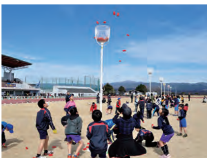
ロードレース後は、アジャタで交流