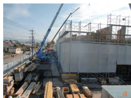
4 12月23日の工事の様子

南小学校は、現在校舎改築の真っ最中で、日々刻々と学校の様子が変化していきます。昨年5月中旬より仮設校舎の建築が始まり、それに合わせて中庭の樹木や運動場の3本の大きな銀杏の木が伐採されました。7月13日には、旧北校舎の機能を仮設校舎に移転しました。8月上旬からは旧北校舎の解体工事が始まり、杭打工事、基礎工事、1階躯体工事を経て、今日に至っております。