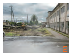
1 取り壊し前の北校舎と中庭 2 樹木が伐採された中庭 3 更地になった北校舎跡地

南小学校は、現在校舎改築の真っ最中で、日々刻々と学校の様子が変化していきます。昨年5月中旬より仮設校舎の建築が始まり、それに合わせて中庭の樹木や運動場の3本の大きな銀杏の木が伐採されました。7月13日には、旧北校舎の機能を仮設校舎に移転しました。8月上旬からは旧北校舎の解体工事が始まり、杭打工事、基礎工事、1階躯体工事を経て、今日に至っております。