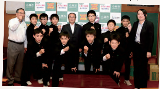
小林中学校新体操部の皆さん