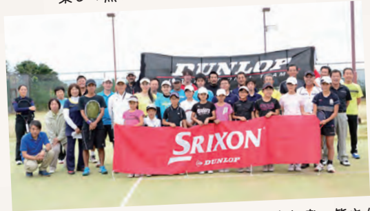
右近プロのテニスクリニック（1日目）参加者の皆さん