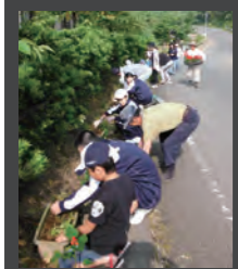
写真① 縦割り清掃による、異学年清掃の様子 写真② 生き生き公民館活動の3世代花植え

永久津小学校は、「先生が元気で、子どもが笑顔、保護者・地域に喜ばれる学校づくり」を目指し、教育活動を行っています。76人の永久津っ子の元気に優しい源は、全校を縦割りにした活動にあります。体力向上を目的とした『太陽の広場』では、6つの班に分かれ、6年生がリーダーシップをとりながら業間の時間に体を思いっきり動かします。この班を活用して体力テスト、ウォークラリーも行います。また、年間を通して『縦割り清掃』を行い、主体性な児童の育成を目指しています。このような活動を通して子ども達同士の交流を図り、笑顔あふれる環境をつくれます。