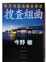
『捜査組曲』 著者: 今野 敏