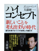
『ハイコンセプト 「新しいこと」を考え出す人の時代』 著者: ダニエル・ピンク 訳: 大前 研一