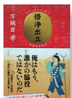
『悟浄出立』 著者: 万城目 学