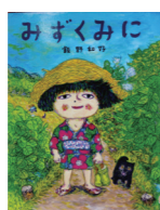
『みずくみに』 作: 飯野 和好