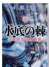
『水底の棘 法医昆虫学捜査官』 著者: 川瀬 七緒