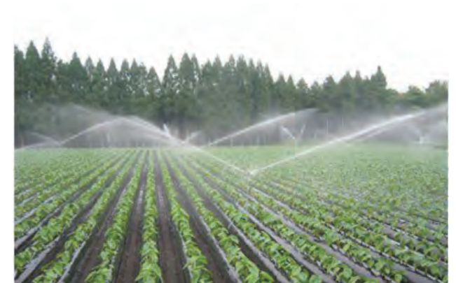
農地に安定した水の供給がされる畑地かんがい事業