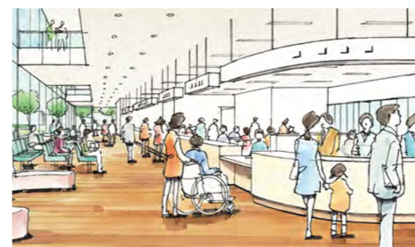
新庁舎の窓口のイメージ図