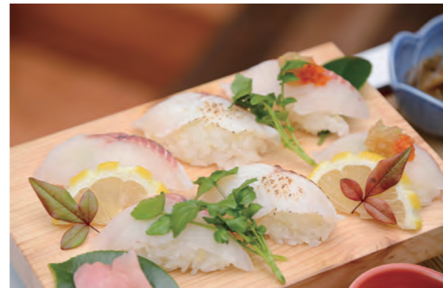
チョウザメの加工品などの開発でブランド化を推進