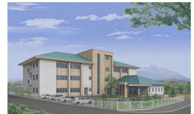
看護医療専門学校は平成 27 年 4 月開校予定です