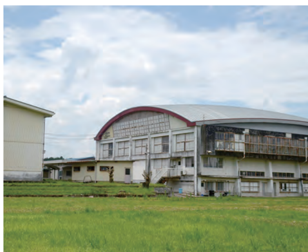
商業高校跡地は平成25年度に購入。改修工事を行い、市民活動や福祉、防災の拠点として活用します