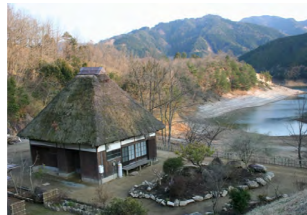
多目的な利用ができる須木の古民家が並ぶ「かるかや」

肉 用牛の改良や放牧技術の普及などで畜産の振興を図る ……1934 万円 (畜産課)