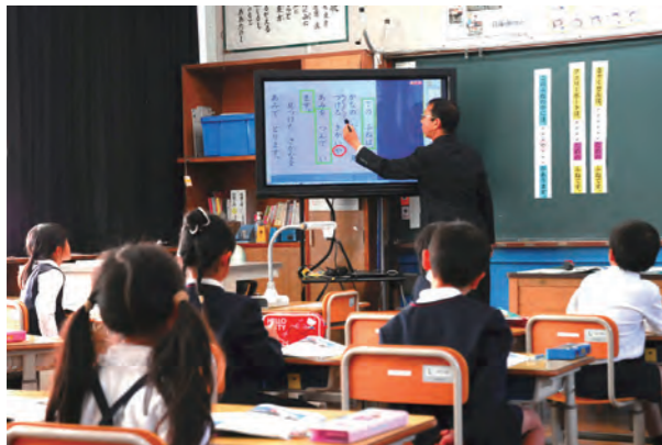
副担任を配置することで生徒の学力向上を目指します

小 学校3年以上で1学級35人以上の学級へ副担任を配置 ……1634 万円 (学校教育課)