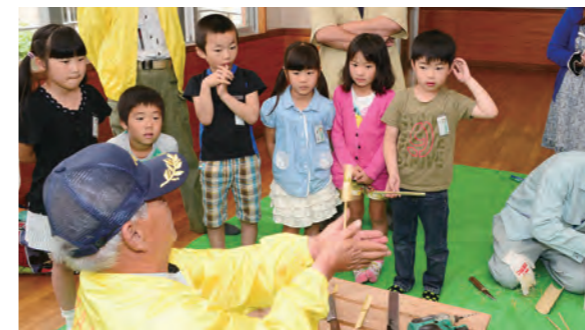
地域の課題解決に向けた活動を支援します