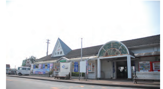
駅の南北通路は平成 27 年 4 月の開通予定です