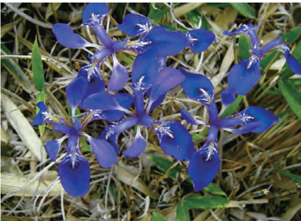
エヒメアヤメは国の天然記念物に指定されています