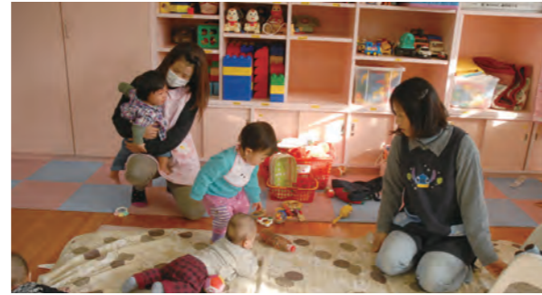
幼稚園と保育所の機能を持った認定こども園の普及を図ります