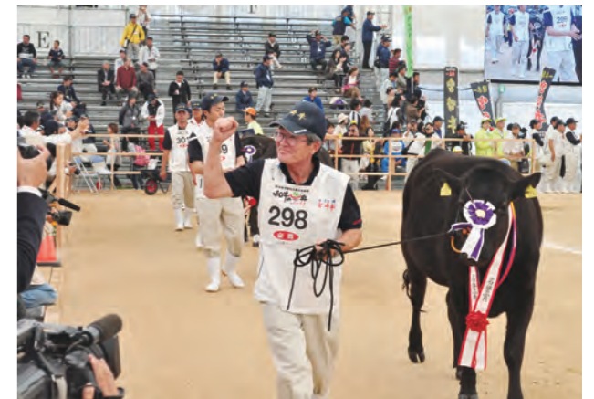
優良牛の地元保留にかかる経費の一部を補助します