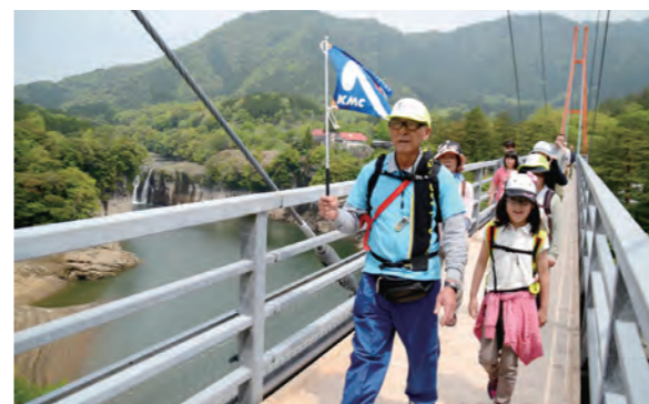
エコパークにも認定された須木の自然を整備します