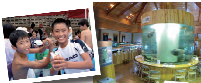
昨年度の魚のつかみ取り大会 出の山淡水魚水族館

夏だ！魚だ！ 出の山に行こう！ 今 年も魚のつかみ取り大会を開催します。小林の名水を生かした魚のつかみ取りは子どもたちに大人気。今回はコイ、マス、ウナギやヤマメが放つ予定です。未就学児から順番につかみ取りを行います。捕まえた魚はその場で焼いて食べることもできます。ぜひ、家族そろって出の山へお越しください。