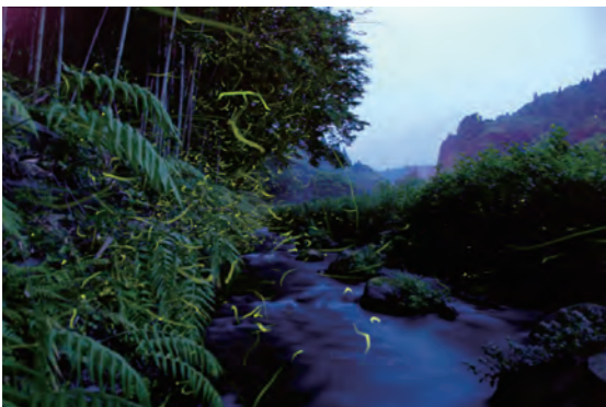
美しく乱舞するホテル