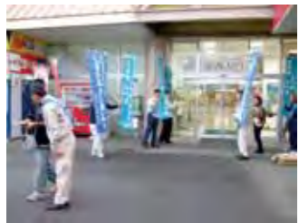
キャンペーンではチラシや、タオル、スポンジなどの景品を配布し、啓発を行いました

での間に変更になります。 ※その他、沈降7価肺炎球菌結合型ワクチンで初回・追加の接種を完了した人は、沈降13価肺炎球菌結合型ワクチンを定期接種としては受けられません