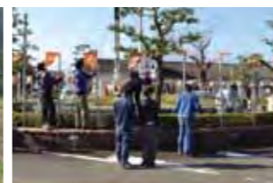
イルミネーション装飾

吉都線100周年記念事業実行委員会では、11月10日に「菜の花の種まき」を行いました。これは、吉都線100周年を機に「将来、沿線をたくさんの菜の花で埋め尽くしたい」との思いで同実行委が企画。にっこばまちづくり協議会の協力をもらい、西小林地区での種まきが実現しました。来年3月には、菜の花が見ごろを迎えます。菜の花の植栽地を提供していただいた皆さま、ありがとうございました。また、16日には恒例の「小林駅前イルミネーション装飾作業」を行いました。例年、冬まつり実行委員会が主催し、同実行委の協力依頼を受け実施しました。吉都線をモチーフにした列車や市の観光イメージキャラクター「こすも〜」などのオブジェを加え、よりパワーアップしたイルミネーションはきっと感動させてくれるはずです。点灯期間は、11月23日から来年1月10日まで。ぜひ、ご覧ください。市では、このような「市民協働のまちづくり」を推進しています。皆様のご理解とご協力をお願いいたします。