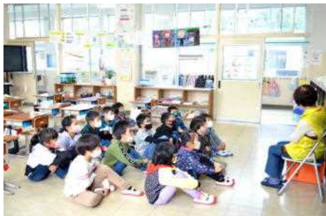
読み聞かせの様子（野尻小学校1年生）