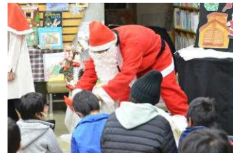
サンタさんからのプレゼントもありました。

有名な曲のフルーツ演奏や、クリスマスにちなんだ絵本の読み聞かせと寸劇、クリスマスの歌の合唱など多彩な内容に、参加した子どもたちは目を輝かせていました。