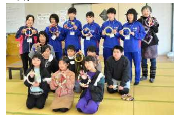
ボランティアに興味のある方は、社協までご連絡ください。

冬休みの宿題を終わらせた後は、全員でリース作りに挑戦し、和気あいあいとした雰囲気の中、素敵なリースを作っていました。