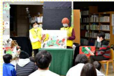
図書館のクリスマス会の1コマ。テンポの良い語りに、子どもはもちろん、大人も物語の世界に夢中になっていました。