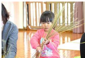
お母さんの熱心な姿に、飛び入り参加した子もいました。

参加された方は、慣れない作業に悪戦苦闘しながらも、お正月を迎えるのにふさわしい、華やかなしめ縄飾りを作り上げていました。