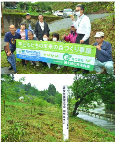
(上) セレモニーの様子 (下) 国道268号線沿いの植栽地

紙屋地区有志会では、平成29年度より地区内の公道沿線等の里山等の再生活動を行っており、紙屋地区の主要な通学路近辺の全整備を目標に、今後も里山の再生活動に取り組んでいくそうです。