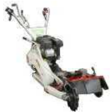
女性や高齢の方でも使いやすいものを、地域整備委員会で選んで購入しました。

安全に草刈り作業ができるよう、輝けフロンティアのじり事務局で「畦草刈り機」を1台購入しました。