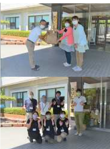
(上) 寄贈されたマスク (右上) マスク贈呈の様子 (右下) マスクを着用した施設職員

受け取った野添施設長は「品薄で注文してもなかなか入荷しないので、とてもありがたいです。」とお礼を伝え、施設の職員と共に早速マスクをつけて業務にあたっていました。