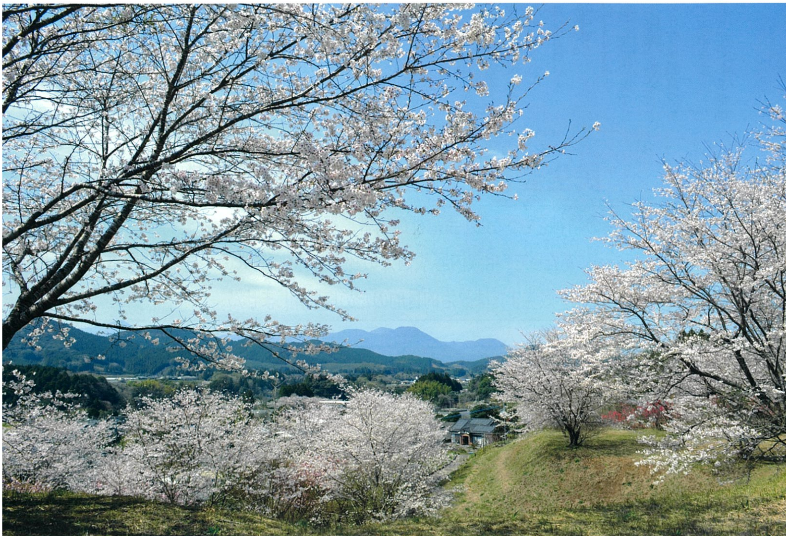
三ヶ野山グラウンド