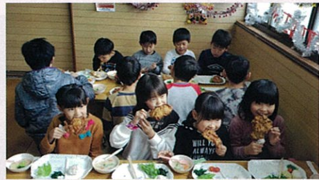
児童クラブの子供たちもお手伝い。