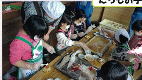
食堂の協力や食材の寄付をいただける方大歓迎

平成30年4月にオープンしたふれあい交流食堂『元気De荘』は2周年を迎えます。 児童クラブや子どもがいる世帯、高齢者までがひとつの空間で食事しながら交流ができる共生型子ども食堂として多くの方に利用していただいています。 食育をテーマに、季節の食材を取り入れ、普段の食卓で並ぶことが少なくなっている料理を織り交ぜ、食事がコミュニケーションツールとしての役割を果たすこともねらいとなっています。