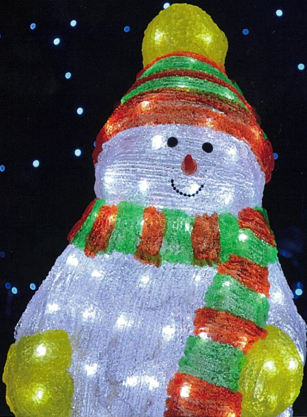
イルミネーション (場所：野尻町追分)