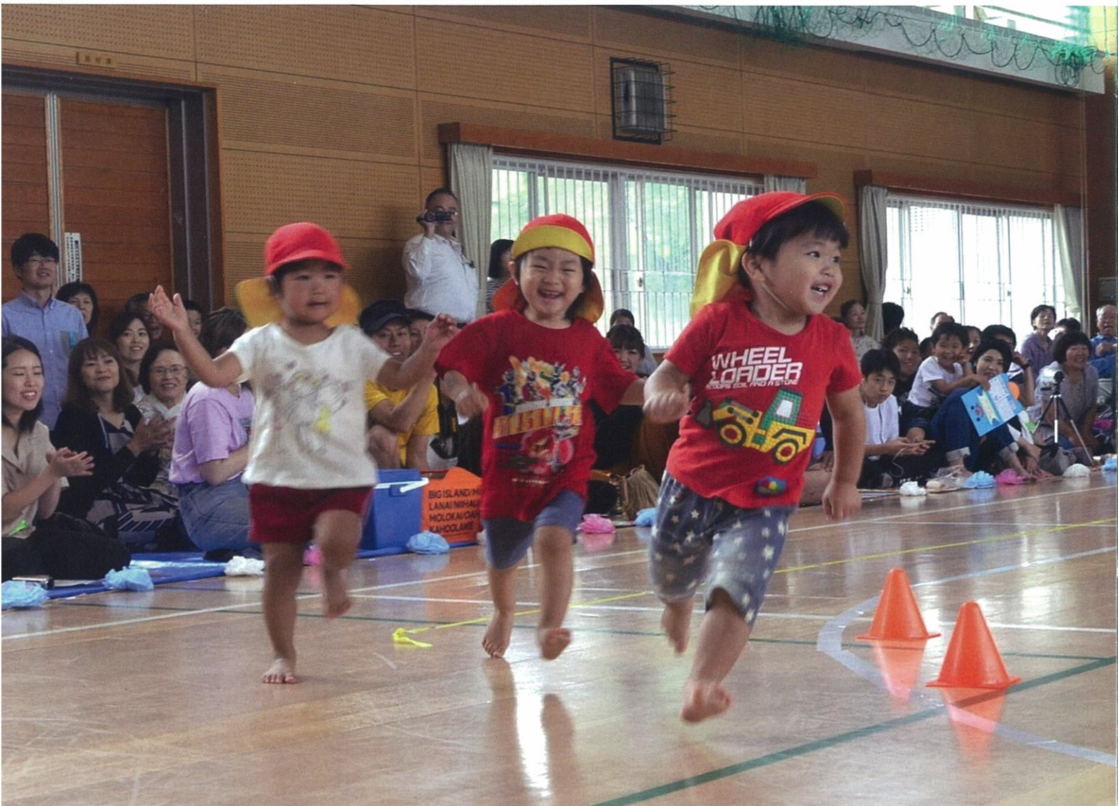
3園合同運動会（栗須・野尻・紙屋保育園）