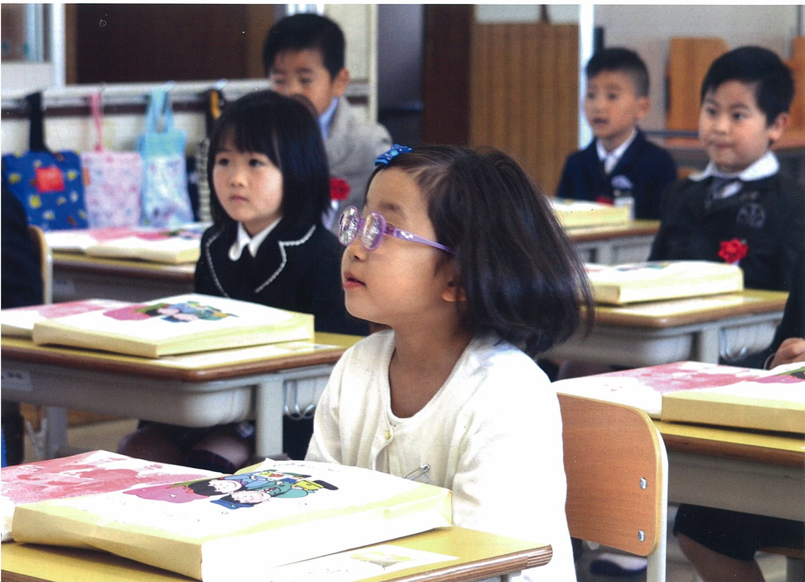
栗須小学校 新1年生