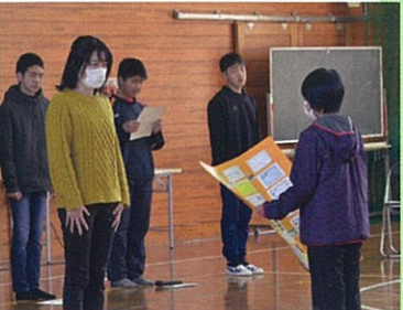
給食感謝集会 (栗須小学校)

先生が「給食を残さないように」と言うのは、たくさんの方への感謝の気持ちと私たちに健康(栄養のバランス)でいてほしいからなのかな!?