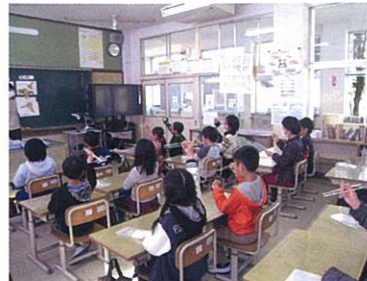
箸の使い方の授業 (野尻小学校)

学校や幼稚園では給食について考える機会をもってもらおうと、こんな取り組みを行っています!