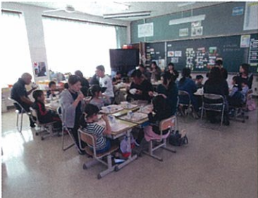
1年生の保護者向けの給食試食会(紙屋小学校)