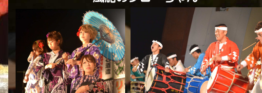
のじりコレクション