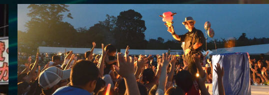
風船のジローちゃん