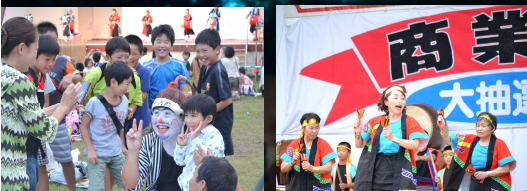
よさこいソーラン夢見隊