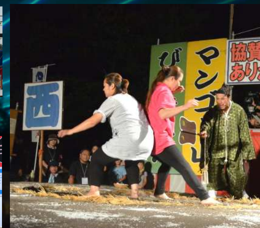
女尻相撲大会 一般の部決勝