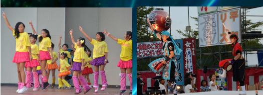
ブレイクガールズ