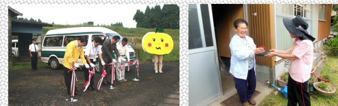
左) 内山・野尻間の新たな運行バス開通式の様子 右) 宅配サービスの様子