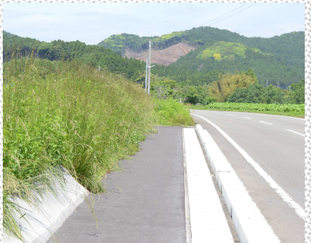
↑歩道の整備をしています