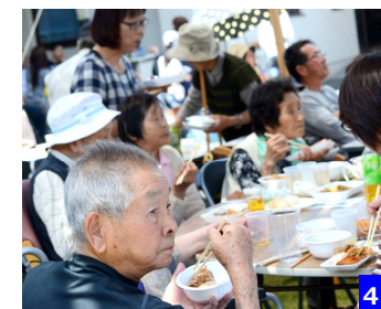
4 利用者による食事の様子