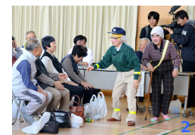
1 講話の様子 2 交通安全指導員による寸劇披露

「高齢者法令講習会」が4月23日、野尻町農村環境改善センターで行なわれました。174名が参加し、講話や寸劇を通じて特殊詐欺被害や交通事故防止対策について学びました。なお、この様子は5月10日放送の UMK テレビ宮崎「みやざきゲンキTV」の中で紹介されました。