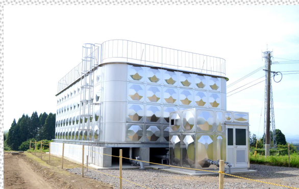
↑昨年度完成した漆野原配水池。本年度場内配管布設工事を行い、各家庭に水を送ります。