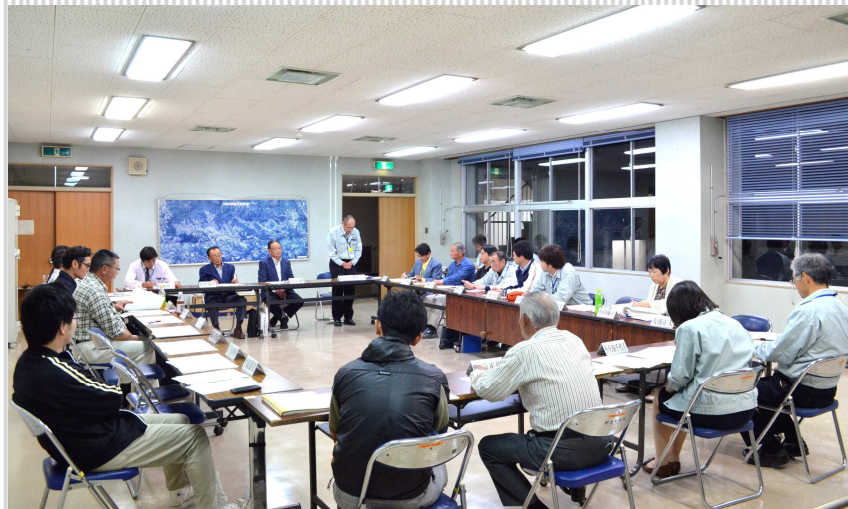
今でしょ!!野尻まちづくり協議会の様子

■ 日程 平成27年6月28日(日) ■ 時間 10:00~ ■ 場所 野尻町農村環境改善センター ■ 問い合わせ 地域振興課 TEL 44-1100 【設立総会の開催日時】 設立総会当日の開催時間が決まりましたのでお知らせいたします。