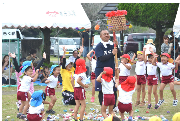
玉入れ競争で大喜びの園児たち

「第48回小林市立野尻保育園うんどろかい」が9月5日に開催されました。園児59名と保護者らが参加。かけっこやリズムダンスなど25の競技が行われ、場内は暖かい声援が送られました。園児たちからは、「綱引きをがんばりました！」「弁当が美味しかった」「練習をがんばってきたよかった！」などといった声が聞かれました。