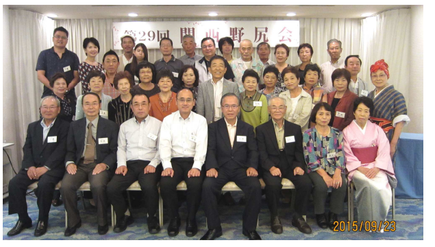
36名が参加。ゲームや演芸、福引、カラオケをはじめ、相互の近況報告や故郷の懐かしい話などで盛り上がりました。