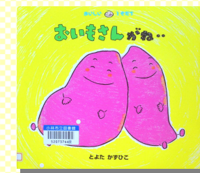
『おいもさんがね・・・』