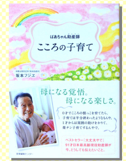
『はあちゃん助産師 こころの子育て』