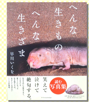
『へんな生きもの へんな生きさま』