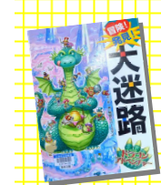
『冒険！発見！大迷路 ドラゴンアドベンチャー』