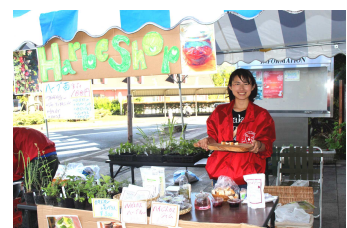
ハーブSHOPも大変好評でした。