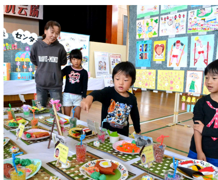
2日間を通じて975名が来場し、賑いました。

野尻町農村環境改善センターで「小林市総合文化祭作品展 野尻会場」が開催されました。保育園・幼稚園児、小学生、一般の方々の様々な想いが込められた作品が出展されました。