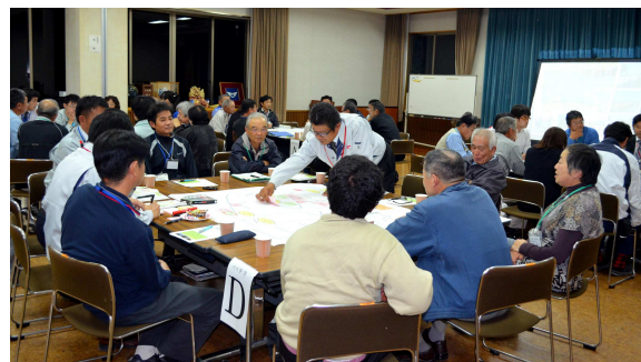
『野尻まちづくり計画』策定に向けた各種団体の意見交換会

また、『野尻まちづくり計画』の策定にあたり協力支援を行っています。11月9日(月)と11日(水)に、各種団体の意見交換会(くらし生き生きWS・住民交流WS・地域整備WS)を開催しましたので、お知らせします。