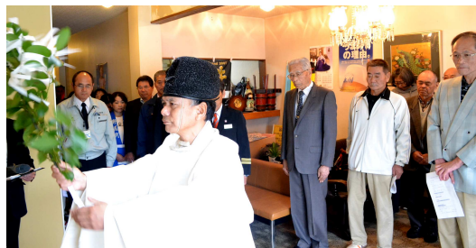
雨天により、隣接する日昇館内での開催となりました。

鵜戸原、吉村、大王区域の住民の皆さんを対象に、高齢者の徘徊による行方不明の発生を想定した「徘徊じゃねどかい? 模擬訓練」が11月8日に開催されました。113名が参加し、実際に声かけの体験や接し方について学びました。参加者は「認知症について考えるきっかけになった」「この経験を今後活かしていきたい」などと話していました。