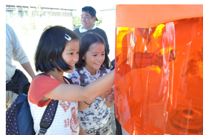
子どもたちに人気です。ぜひご利用ください。