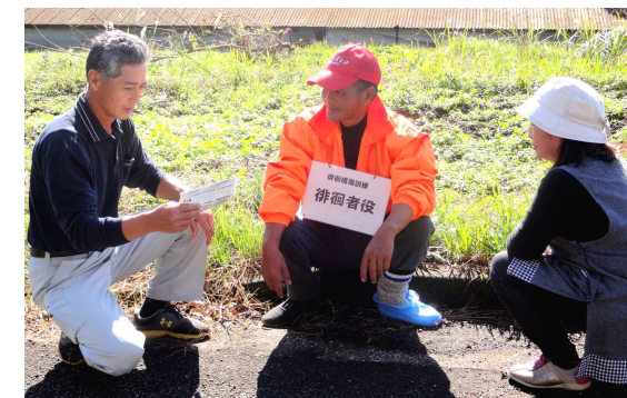
「正しい認知症の理解」や「対応の心得」の理解を深め、地域全体で“声かけ”を体験しました。

鵜戸原、吉村、大王区域の住民の皆さんを対象に、高齢者の徘徊による行方不明の発生を想定した「徘徊じゃねどかい? 模擬訓練」が11月8日に開催されました。113名が参加し、実際に声かけの体験や接し方について学びました。参加者は「認知症について考えるきっかけになった」「この経験を今後活かしていきたい」などと話していました。