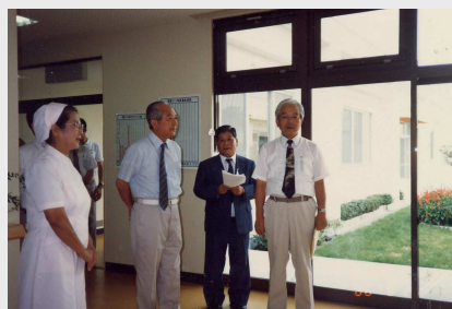
特別養護老人ホーム・きりしまの園 開園式

町長を退かれてからは、小林高原野尻漁業組合長を平成19年まで長きにわたって努められました。生前の功績を偲び、ご冥福をお祈りいたします。