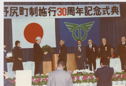
野尻町制施行30周年記念式典