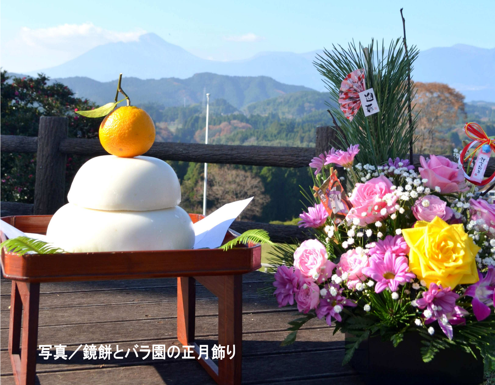
写真/鏡餅とバラ園の正月飾り