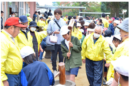
餅つきが終わった後、柔らかい餅を試食していました。