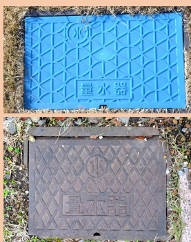
①メーターボックスの場所を確認 ※2種類あります!

メーターボックス内にある元栓を開めてください。(水が出なくなります)そして、水道業者に連絡をして修理をしてもらってください。