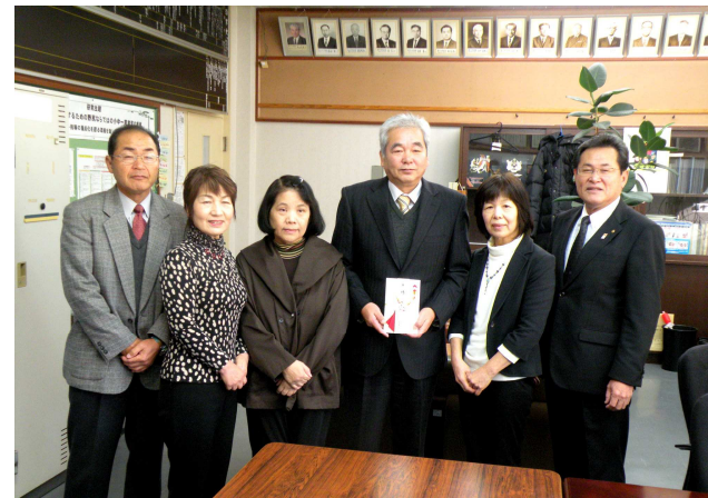
昭和45年度卒業生が還暦祝いで寄付