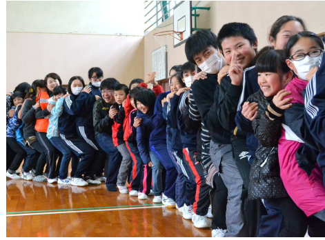
3月19日に開催される「ギネス記録に向けた椅子座りの練習の様子

紙屋小中の児童・生徒、保護者を対象として2月13日に開催されました。雨天の影響で内容が変更となり、地域の方のお話やリーダー養成レクレーションなどを実施。最後は、紙屋地区営農組合地域生活部の皆さんにより豚汁が振舞われました。