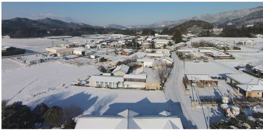
大寒波による上空からの景色 (三ヶ野山)

災害による被害をできるだけ少なくするために、日頃からの防災対策が必要です。そこで大切なのが、一人ひとりが取り組む「自助」。正しい知識を持ち、いざという時に備えましょう。