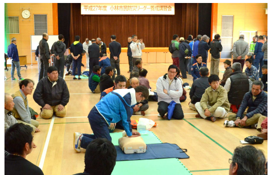
1月31日開催の防災リーダー養成講習会では、救急法や防災対策などについて説明・指導がありました。