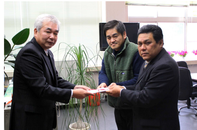
平成2年度卒業生が厄払いで寄付