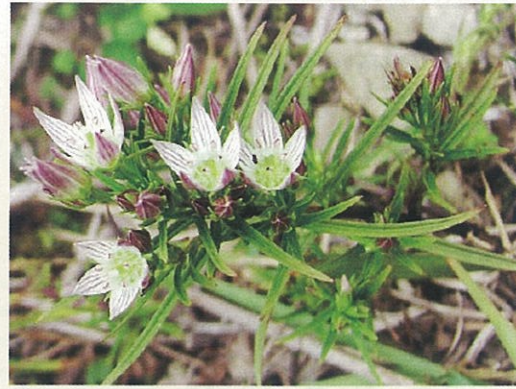
▲今では珍しいセンブリ

薬草センターでは県内で自生する薬草や世界中のハーブなどを栽培しています。入場無料で自由に見学でき、図書やレシピアなどの閲覧もできます。薬剤師による園内案内（期間限定）や、料理教室なども開催しています！（薬草センター 216061）