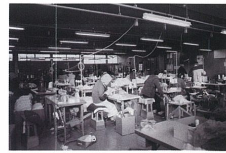
▲三巧ニット（株）の内部

野尻町商工会設立時は、会員数176名。業種は食料品販売、衣料品販売、菓子製造、林業、建設業、理容業、酒販売業、鉄工所、製茶業、製麺業…など、三十七種類と多様な業種で成り立っていました。旅館や搾油業、桶製造など、今はない業態も多々見当たります。 また、昭和四十年代まで重要産業だった甘藷でん粉工場や、誘致企業第一号の「三巧ニット株式会社」（昭和四六年創業開始）など工業の形態も移り変わってきました。