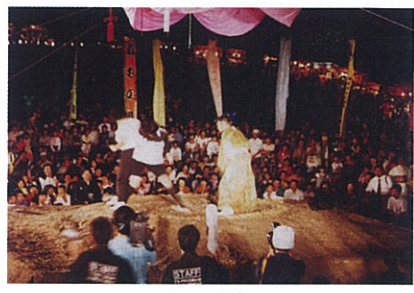
▲のじり湖祭「女尻相撲」