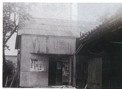
▲町内唯一の映画館（昭和36年）