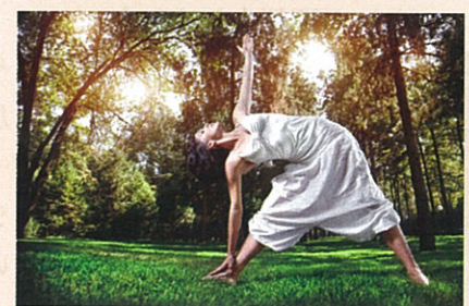
▲写真はイメージです。