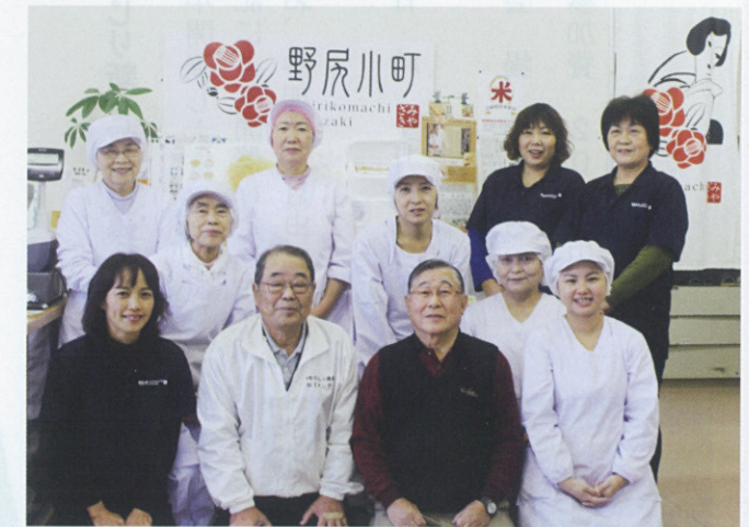
▲概ね40代～70代の幅広い世代が活躍。商品作りを通して郷土の味が伝承されている。