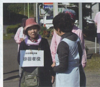
徘徊模擬訓練の様子

のじりオレンジの会は「認知症」について勉強をした地域の住民です。認知症は誰でもなりうる“病気”です。会では地域のみんなで見守り、支え合って暮らせる町づくりのために以下の活動をしています。