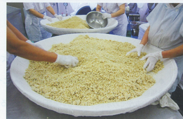
▲全員が食品衛生責任者の資格を取得し、徹底した衛生管理を行っている。

さとはびは平成十年、高齢者の豊富な経験と能力を活かし、昔から伝わる伝統的な工芸品の継承をはじめ、主に旧野尻町内で生産される農産物を利用した加工品をつくり、その付加価値を高めることを目的に設立されました。味噌やあくまき、ゆべしなどの商品は、「野尻町農産婦人の家」で受け継がれてきたレシピを基に作り、野尻に伝わる郷土の味が再現されています。