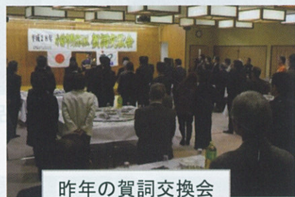
昨年の賀詞交換会

あけましておめでとうございます。皆様におかれましては輝かしい新年をお迎えのこととお喜び申し上げます。わたしたちのまち野尻を自然豊かなまちみんなに誇れるまち、野尻に住んでよかったまちにしたい。輝くのじりのまちづくりは私達です。野尻はひとつ！一人ひとりがまちづくりに参加しましょう。皆さんと共にまちづくりを進めて参ります。新しい年がより輝く年でありますようご祈念申し上げます。