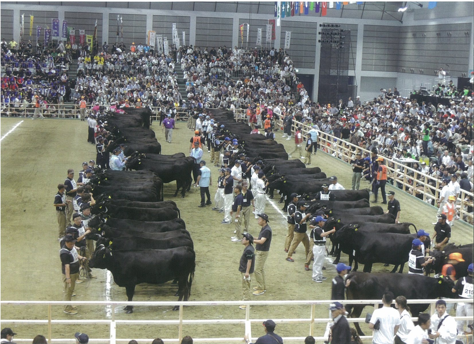
全国和牛能力共進会（宮城県）