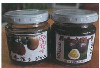
キウイジャム (400円) 左、パッションフルーツジャム (800円) 右

ジャムは日持ち (約半年) もするし、パンに塗ったりヨーグルトに混ぜたりたくさんの方々が使っていますよ！