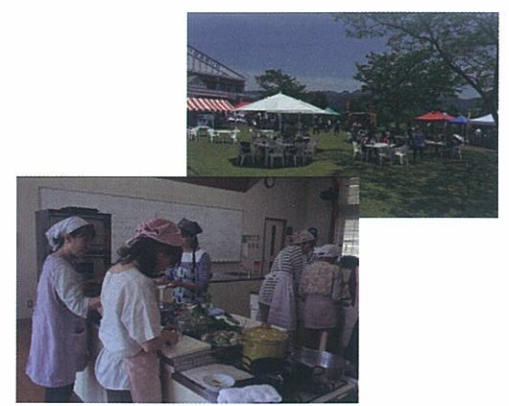
旬の野菜とハーブのワークショップ

日程 10月29日(日) 時間 10時～15時 場所 問 薬草・地域作物センター TEL (21) 6061