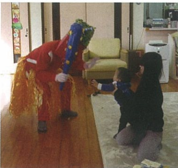
～子育て支援センター～