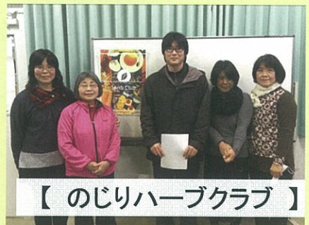
【のじりハーブクラブ】

ハーブには意外なものも多く、私の周りにはあふれています。そんなきれいな色・香り・可愛さから魅了され約15年前から栽培をしています。レストラン用の料理ハーブや西洋野菜を主に栽培し、宮崎市内のお店で販売しています。今は一人で栽培していますが、一緒にできる人がいたらもっと楽しいことができんじゃないかとわくわくする夢がいくつもあります。