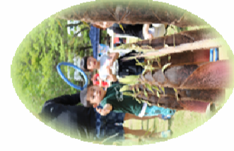
小林幼稚園 太鼓演奏