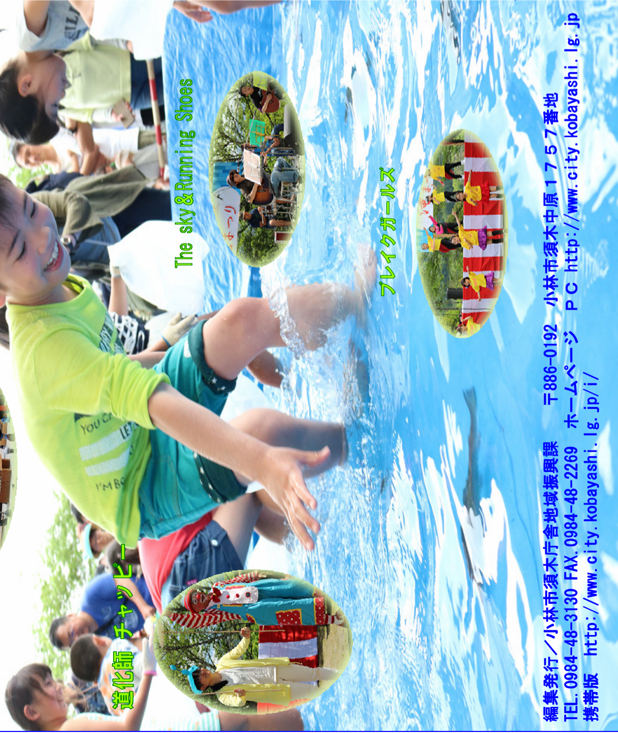
道化師 チャッヒー