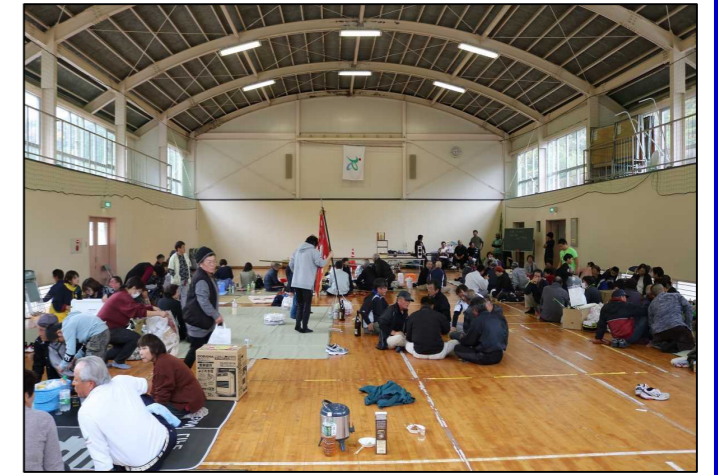
（奈佐木ほぜまつり）

11月23日（土）に、奈佐木地区・内山地区にて毎年恒例の地区行事であるほぜまつりが行われました。