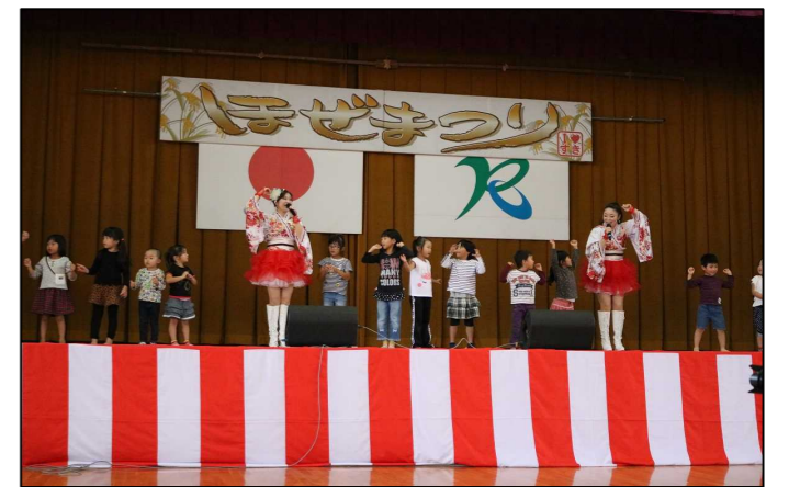
(ソフトクリームス)