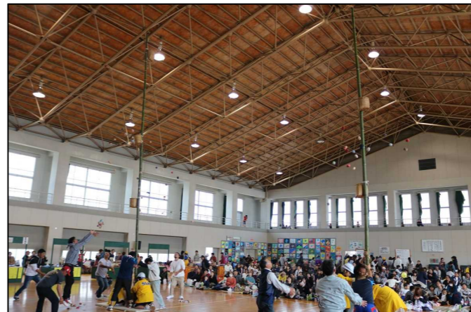
(地区対抗玉入れ選手権)