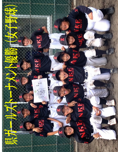
県ガールズトーナメント優勝(女子野球)