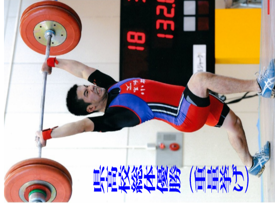
県高校総体優勝(重量)