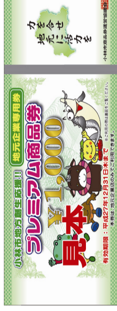
地元企業商品券(見本)

小林市商品券運営協議会(小林商工会、野尻町商工会、すき商工会)では、小林市からの業務委託を受けて、消費者の購買意欲の喚起を図り、小林市の経済活性化に資することを目的として小林市プレミアム商品券並びに小林市子育て支援商品券の発行運営業務を実施いたします。