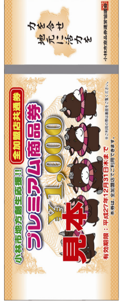
全加盟店共通商品券(見本)