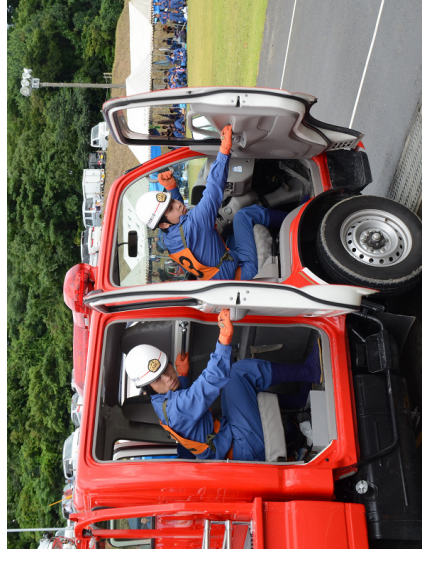
小型ポンプ積載車の部 優勝 第7分団第5部（奈佐木）

今年の夏も消防団員にとって、厳しい訓練の日々が続きました。各部とも早朝、夕方に訓練を行い、操法技術の向上を目指しました。 7月13日（日）に開催された、小林市消防団夏季点検操法競技では、緊張感に包まれる会場で、日々の訓練してきた技術を競い、素晴らしい操法を披露してくれました。 その中で、四連覇のかかる第5部（奈佐木）が、見事に優勝を手に入れました。惜しくも第7部（内山）が僅差で第2位、ポンプ車の部では第6部が第5位と健闘しました。優勝した5部は、7月27日に開催される、西諸地区大会に小林市代表として出場します。