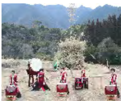
勇壮な六奏太鼓の演奏