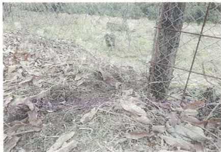
▲ 金網のつなぎ目の隙間からイノシシが地面を掘り返し、侵入した後

※年間をとおして有害鳥獣の被害等に あわれた方は下記までご報告下さい。 [問い合わせ先] 須木庁舎 地域整備課 TEL 48-3131