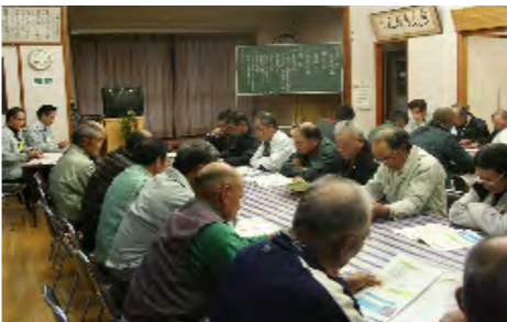
（上九瀬地区説明会）