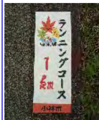
(シールタイプの距離表示板)