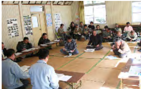
（中河間地区説明会）