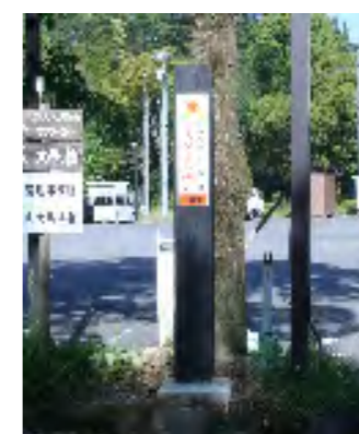
(支柱タイプの距離表示板)

ランニングコースを整備 湯をすきむらんど温泉 ニングコースの整備 まに敷いたグリス 堂に敷いたグリス 方を片道片道 大に片道片道 設けたいまは コソリキス 距離を計る 分る も良 きも良 いて感 。感 。感