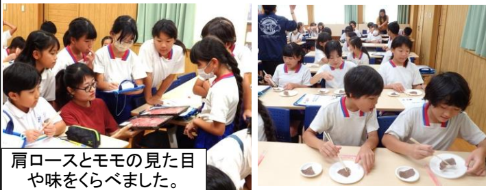
肩ロースとモモの見た目や味をくらべました。

JA宮崎経済連・JAこばやし・生産者による宮崎牛の授業です。DVDと説明、質問コーナーを通して、宮崎牛の出産から出荷・販売までを学ぶとともに、生産者に、仕事についてのお話を聞きました。