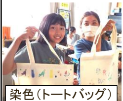
染色(トートバッグ)