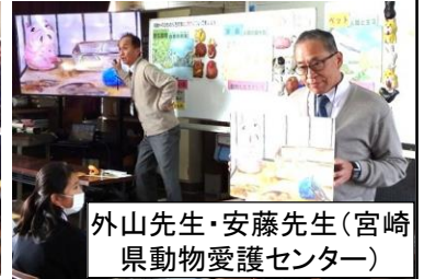
外山先生・安藤先生(宮崎県動物愛護センター)

この1週間前、宮崎県動物愛護センター(清武町)で授業を受けており、参観日の今回が2回目の授業です。絵や写真を見て、野生動物や家畜、ペットの気持ちを想像し、動物へのかかわり方を学ぶとともに、動物に対して自分ができていることを考えました。