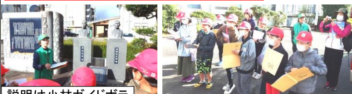
説明は小林ガイドボランティア協会の皆さん