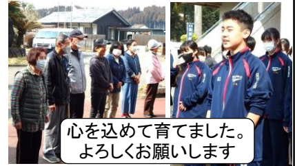
心を込めて育てました。 よろしくお願いします

大事に育てたペチュニアの鉢に手紙を添えて、70数軒の高齢者宅に届けました。配達ボランティアの皆さん。毎年届く「春の便り」を楽しみにしている方々も多いことでしょう。【手紙より】(まだまだ寒い日が続きますので、お体に気を付けて、元気にお過ごしください。)