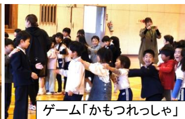
ゲーム「かもつれっしゃ」

細野保育園と認定こども園日章の年長組との交流会。1年生は歌と合奏、「おおきなかぶ」のペープサートを披露し、園児は、太鼓の演奏や「1年生で頑張りたいこと」を発表しました。