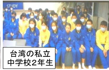
台湾の私立 中学校2年生

海洋汚染の問題や、学校で行っている用紙の再利用のことなどを互いに英語で発表しました。難しいテーマでしたが、紙屋中では学年ごとにプレゼンテーションをまとめ、発表しました。