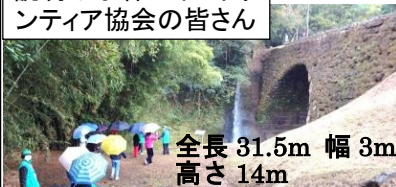
全長 31.5m 幅 3m 高さ 14m

用水路の学習です。野尻庁舎で記念碑についての話を聞いた後、東方大丸太鼓橋を見学。須木のふるさとセンター近くにある