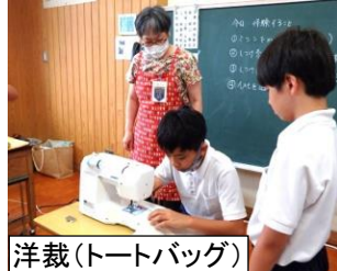
洋裁(トートバッグ)