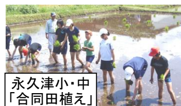
永久津小・中 「合同田植え」

学校には、長く続いて伝統になっている地域学校協働活動もあることでしょう。KSSVCが保存している10年前の写真から6つを紹介します。