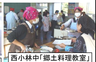
西小林中「郷土料理教室」