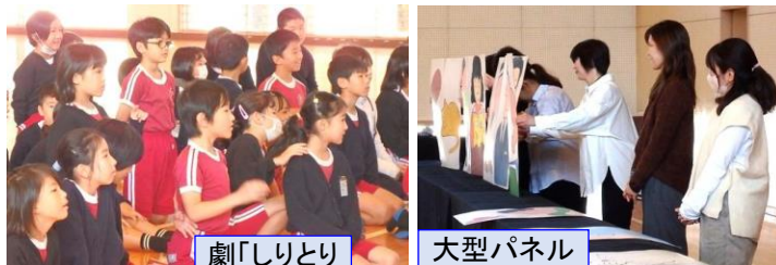
劇「しりとりのだいすきなおうさま」