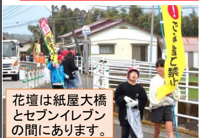
花壇は紙屋大橋とセブンイレブンの間にあります。