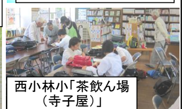
西小林小「茶飲ん場(寺子屋)」