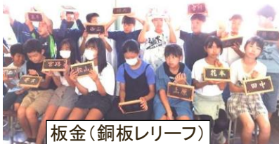
板金(銅板レリーフ)