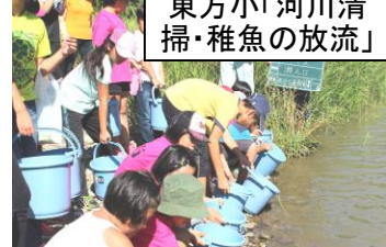
東方小「河川清掃・稚魚の放流」