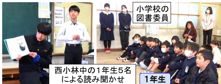
西小林中の1年生5名 による読み聞かせ